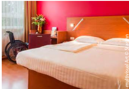
multivisual Art © Star Inn

Je nach Vorliebe, Geldbeutel oder Mobilitätseinschränkung von der Jugendherberge bis zum 5-Sterne-Hotel. Hier schlafen Sie gut nach spannendem und genussvollem Tag.