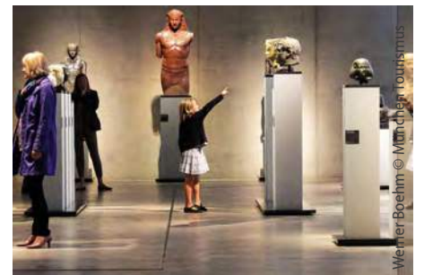
Werner Boehm © München Tourismus

Die Vielfalt lässt jedes Herz höher schlagen. Genießen Sie die zahlreichen Theater, Konzerthäuser und Museen, die Königliche Residenz oder das Schloß Nymphenburg.