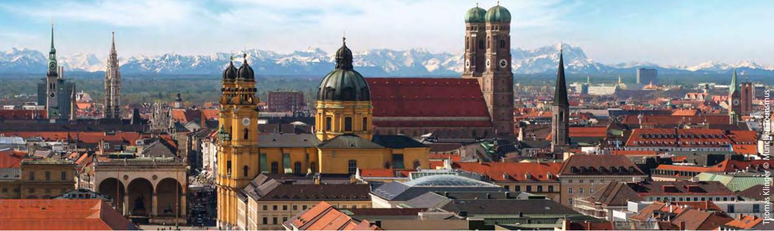
Thomas Klügel © München Tourismus