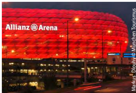
Markus Diouhy © München Tourismus

In München gibt es nichts, was es nicht gibt. Werden Sie selbst aktiv oder fiebern Sie mit bei den großen Sportveranstaltungen oder Konzerten besonders im Olympiapark oder der Allianz-Arena.